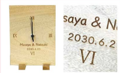
時計 木材にレーザー加工で、あたたかみのある風合いに。これからの二人の大切な時間を刻みます。