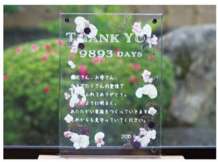
両親への手紙 ウェルカムボードはもちろん、両親への手紙もアクリルなどのボードにして、プレゼントや記念に。

彫刻機やレーザー加工機を使用して加工をする部署「LABO」。今回は『ブライダルフェア』に参加しました。お二人の記念日に、お二人だけの特別なモノを。お二人だけの「オンリーワン創り」をお手伝い致します。