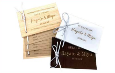
ゲストブック 鞆のまち豊岡ならではの革で作ると一味違ったものに。

発行 浮田産業株式会社 www.ukitasangyo.jp mail: info@mail.ukitasangyo.jp ■ 本社 〒668-0021 兵庫県豊岡市泉町9-13 TEL:0796-22-7111 FAX:0796-24-3983 ■ 自社ファスナー加工工場 〒668-0026 兵庫県豊岡市元町5-4 TRUSPA ■ 東京支店 〒111-0053 東京都台東区浅草橋3-1-8 アダックスビル6F TEL:03-5820-8168 FAX:03-5820-8167 ■ 東京ファスナー工場 〒111-0051 東京都台東区蔵前4-17-11 TEL:03-5809-1708 ■ 大阪支店 〒534-0025 大阪府大阪市都島区片町1-5-13 大手前センチュリービル5F TEL:06-4309-6500 FAX:06-4309-6501