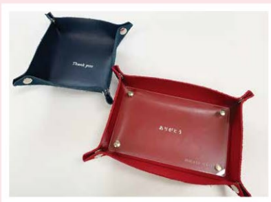
革トレー 真ん中にメッセージが入れられます。アクリルには日付とお二人のイニシャルを♪