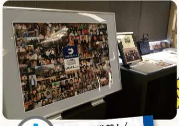
1 見所満載! 歴史資料

昨年の設立50周年記念式典の写真や、浮田産業の現在までの歴史や資料、写真を展示しております。社員が若いころの写真など、見どころ満載です!