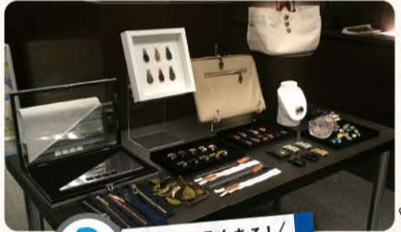
3 超貴重品もある! 鞆

今では貴重な皮革の鞆や、浮田産業の資料を展示しております。言葉では伝わりにくいので、是非お越しください!