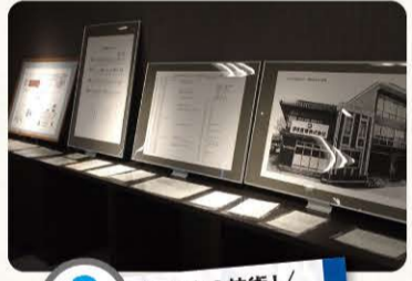
2 日本の技術! 金具の歴史

昨年の設立50周年記念式典の写真や、浮田産業の現在までの歴史や資料、写真を展示しております。社員が若いころの写真など、見どころ満載です!