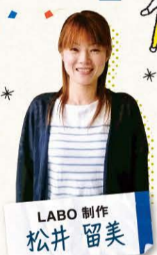
LABO 制作 松井留美

持ち前の明るさとポジティブさを面に出しがなっています！彫刻のことなら、なんなりとご相談下さい。よろしくお願いいたします。