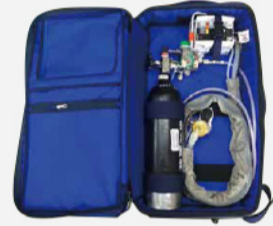
消防用酸素ボンベバッグ