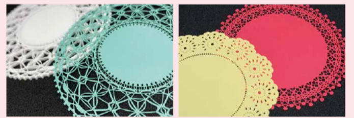
アクリル(白)、紙(水色)