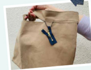
ファスナーの引手の上げ下げが癖になります!