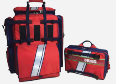
ドクターカー用バッグ