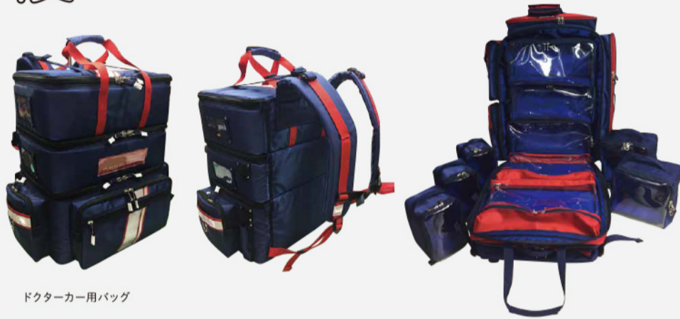
ドクターカー用バッグ

そもそも医療用のバッグは種類が少なく選択幅が狭いため、救命現場に持って行きたいものがたくさんあっても、既製品の鞆には入りきらなかったりします。また、持ち運びたい資機材が10キロを超え、背負って走るとリュックのファスナーが重みで勝手に開き、中身が出てしまうということも起こったそうです。